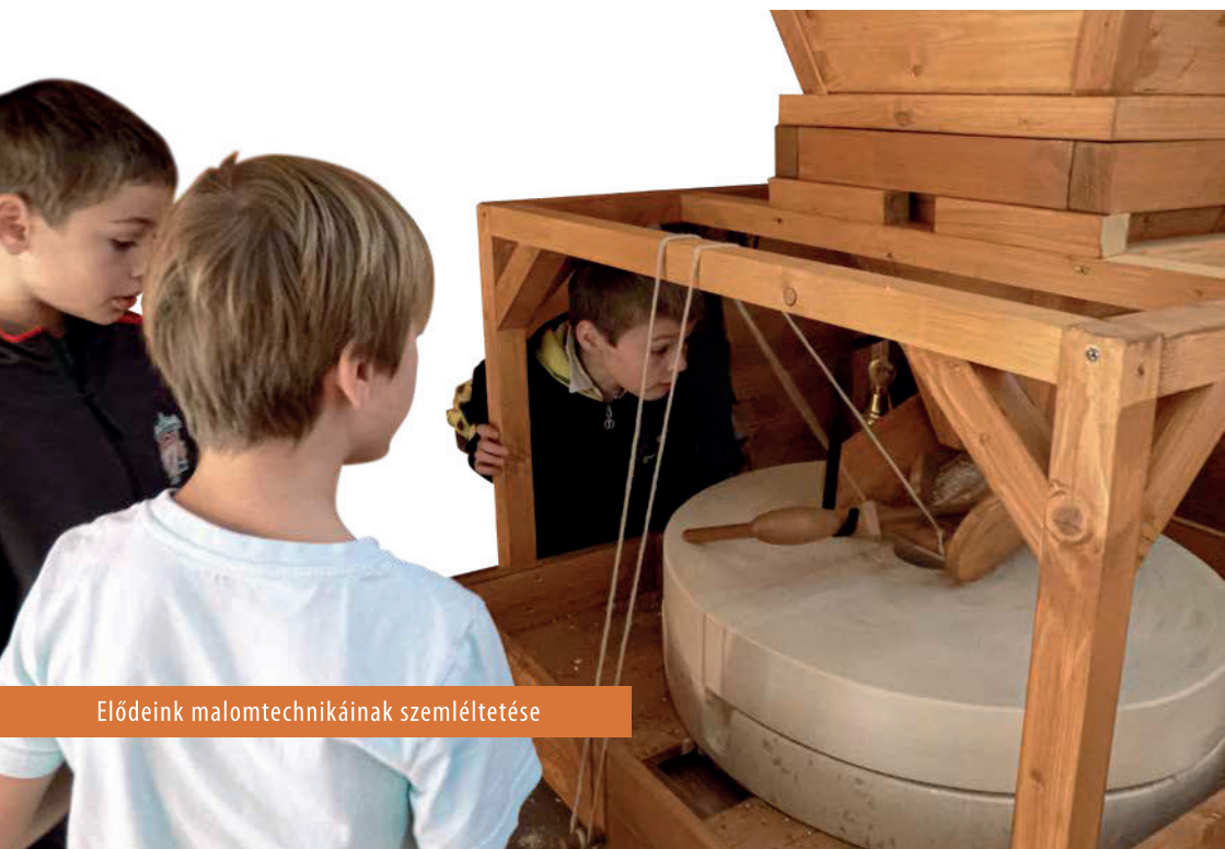
Elődeink malomtechnikáinak szemléltetése

Az emeleten kialakított rendezvényterem tökéletes választás konferenciák, előadások megtartásához. A helyszín megosztható, így 68-125 főig megfelelő. A terem klimatizált, projektorral és hangosítással felszerelt.