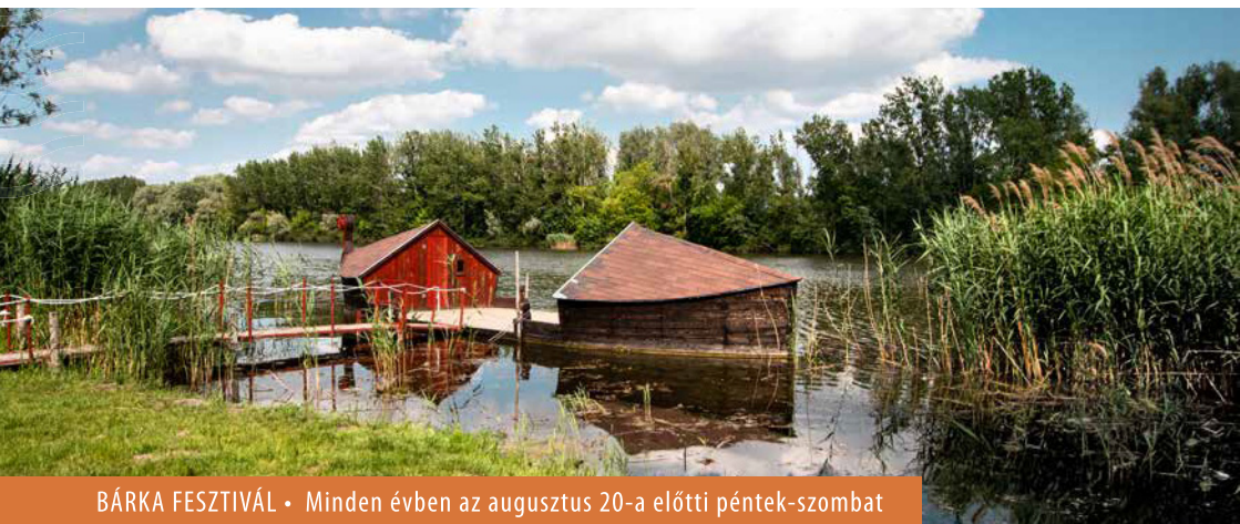
BÁRKA FESZTIVÁL • Minden évben az augusztus 20-a előtti péntek-szombat

hogy "Tolna-szeretetből" megépítik a bárkát. Az építést az erdélyi testvértelepülés, Uzon 12 köbméter vörösfenyő deszkával támogatta, a többi faanyagot az önkormányzat vette meg. A bárka régi tolnai fényképek, festmények, mai bárkák tanulmányozása és a fellelt szakirodalom alapján készült. Súlya 12 tonna, hossza 14 méter, szélessége 4 méter, merülése 70 cm. Haltárolásra ma már nem használják, 2009 óta városképi funkciót tölt be.